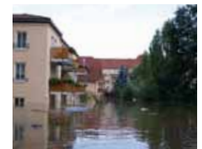
Hochwasser in der Stadt