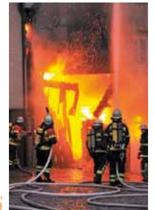
Hausbrand in Monschau, Nordrhein-Westfalen 2008