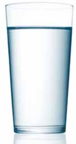
Der Mensch kann nur 4 Tage ohne Flüssigkeit auskommen

› Überprüfen Sie regelmäßig Ihre Vorräte. Eine Checkliste finden Sie in der Mitte der Broschüre!