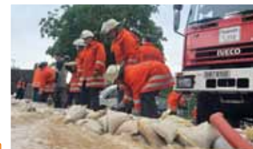
Schutzwälle aus Sandsäcken